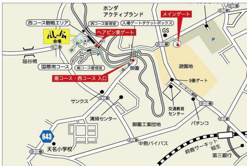
風の会 開催会場案内図

乗車にあたってはボランティアがサポートし、専用のベルトを装着して頂きますので、上肢・下肢の不自由な方でも安全に走行を楽しんでいただけます。